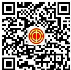
湘工 e 家微信公众号

4. 做好典型案例推荐。 请各地根据具体工作情况推荐 1-3 名“求学圆梦行动”典型案例至省总，典型应为 2021-2022 年专项资金申报中具有代表性的人物，事例要求真实、感人，具有积极向上的正能量。请于 10 月 30 日前将《“求学圆梦”行动典型推荐表》（附件 3）、800 字文字介绍和 3 分钟以内短视频发送至邮箱： hnghxw@163.com 。